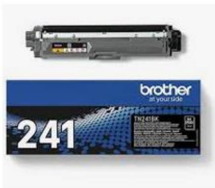
Brother DCP-9020 CDW Toner und ... tonerpartner.de