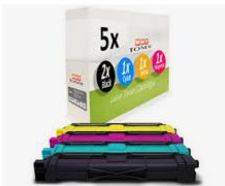
5x MWT Toner Compatible for Brothe... ebay.com