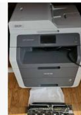
Brother DCP 9020CDW ... ricardo.ch