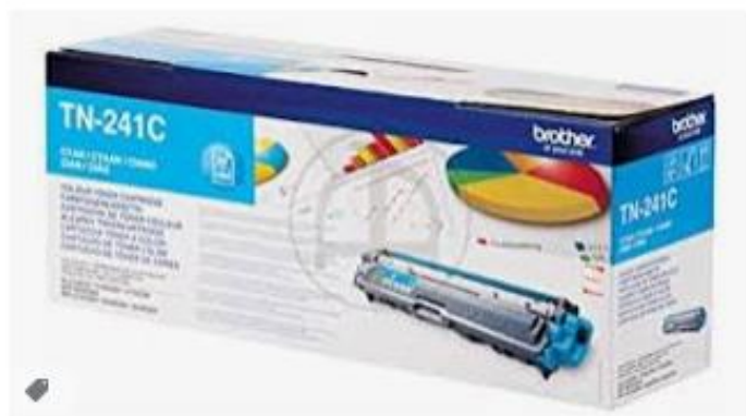
Brother original Toner TN-241C NEU TN 241 cyan HL-31... amazon.de