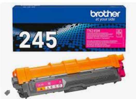
Brother 245 Original-Toner TN245M Mage... toner-dumping.de · Auf Lager