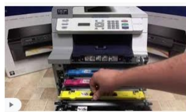
Brother DCP-9042CDN - Change Toner Cartridge - Y... youtube.com