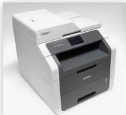
Brother DCP-9020CDW DCP 902... buerotech24.de