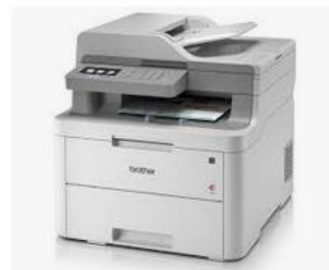
Toner für Brother DCP L 3550 CDW s... tintenmarkt.ch